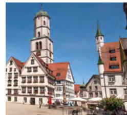
Marktplatz – einer der schönsten in Süddeutschland