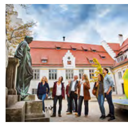
Der Hospital – einer der größten mittelalterlichen Gebäudekomplexe