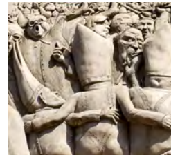
Marktplatz mit Eselskulptur von Bildhauer Peter Lenk