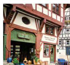
Weberberg – die ehemalige Zunftsiedlung der Weber mit historischem Fachwerk