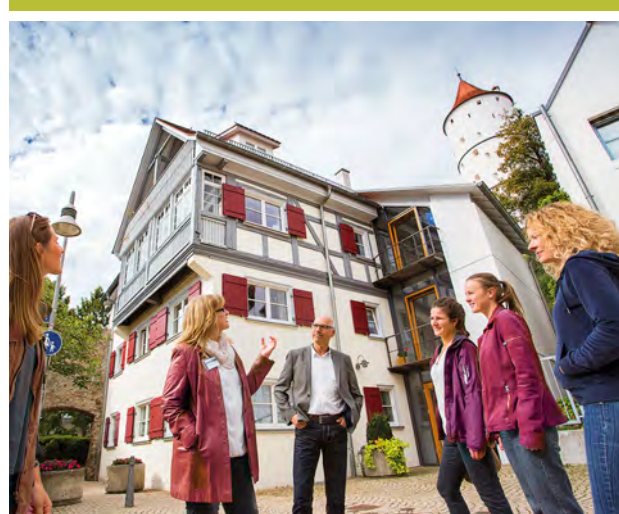
SAMSTAGS 14:00 UHR MITTWOCHS (MAI BIS OKT.) 14:00 UHR

OHNE ANMELDUNG TREFFPUNKT: Spitalhof, Museum Biberach MINDESTTEILNEHMER: 6 Personen PREISE: Erwachsene ab € 6,- Schüler/Studenten ab € 3,- Kinder bis 10 Jahren kostenfrei