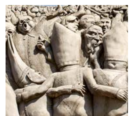
Marktplatz mit Eselskulptur von Bildhauer Peter Lenk