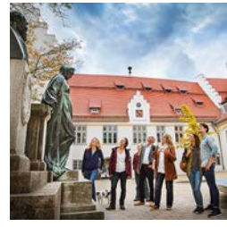
Der Hospital – einer der größten mittelalterlichen Gebäudekomplexe