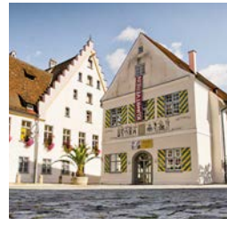
Komödienhaus – Erstaufführung des Shakespeare-Stückes „The Tempest“ als „Der Sturm“