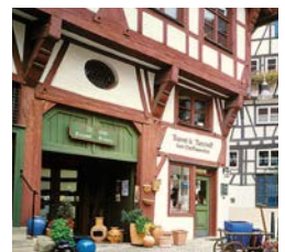
Weberberg - die ehemalige Zunftsiedlung der Weber mit historischem Fachwerk