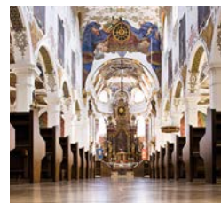
Stadtpfarrkirche St. Martin - eine der ältesten Simultankirchen Deutschlands