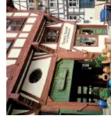
Weberberg – die ehemalige Zunftsedlung der Weber mit historischem Fachwerk