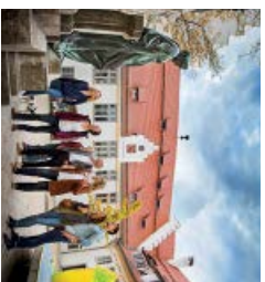
Der Hospital – einer der größten mittelalterlichen Gebäudekomplexe