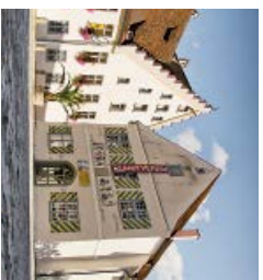
Komödienhaus – Erstauflührung des Shakespeare-Stückes „The Tempest“ als „Der Sturm“