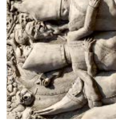
Marktplatz mit Eislskulptur von Bildhauer Peter Lenk